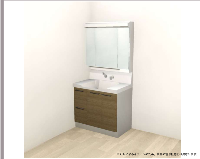
※CGによるイメージのため、実際の色や仕様とは異なります。