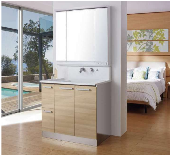
※イメージ写真（ミルクアッシュ）LED照明となります。